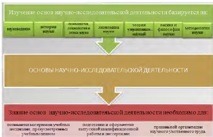
Рисунок 2 – Связь курса с другими дисциплинами